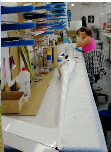
Kuva 10. yrityksen tuotantotiloja