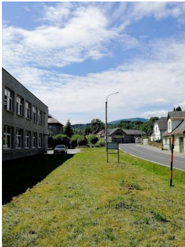
Kuva 9. Baudis Model toimitilat