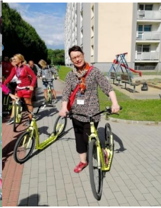
Kuva 7. potkulautapyörä