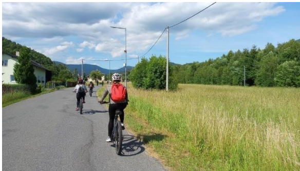
Kuva 1. sähköpyöräilyä Desná-jokivarren kylien läpi