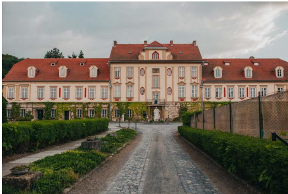
Kuva 13. Strelnice -kokonaisuuden rakennuksia