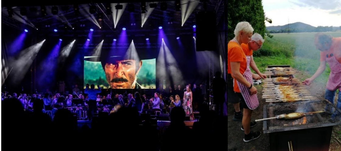
Kuva 19. Garden party -illan konsertissa kuultiin elokuvamusiikkia. Kuva 20. Garden party-illan tarjoiluja

Pienessä 1600 asukkaan kylässä on valtava yhteisöllisyyden voima, illan järjestelyissä mukana nuoret ja paikalliset toimijat. Siellä järjestettiin viimeisen päälle huikean hieno elokuvakonsertti (kuva 19) jälleen ihan mahtavan sinfoniaorkesterin ja usean eri laulajan värittämänä! Tšekkiläiset ovat vahvoja musiikin ja kulttuurin korkeatasoisia taitajia. Ruokailu ja juomien tarjoilu hieman epäonnistui sillä paikallinen loimukala ja grilliporsas loppuivat kesken (kuva 20), yhdelle juomapisteelle oli vähintään tunnin jono, joten viimeisimmät ruokailijat saivat makkaraa. Loppuhuipennuksena valtava iletulitus.