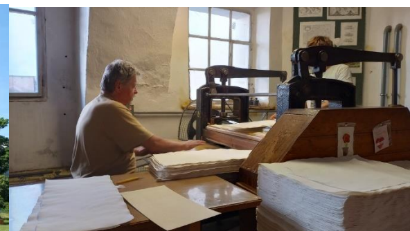
Kuva 4. paperinvalmistusta Velké Losinyn tehtaassa