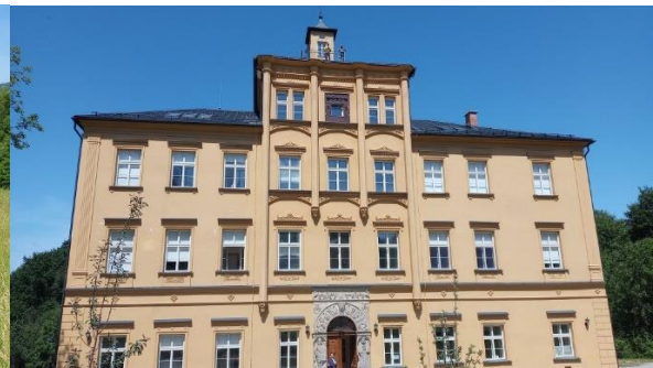
Kuva 2. monitoimitalo Chateau Třemešek