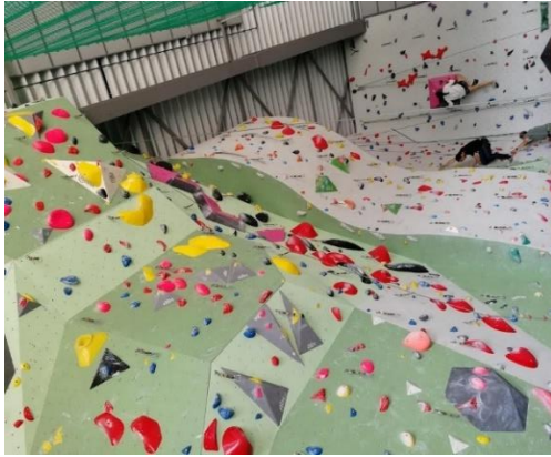
Kuva 6. kiipeilyseinä urheiluhallilla