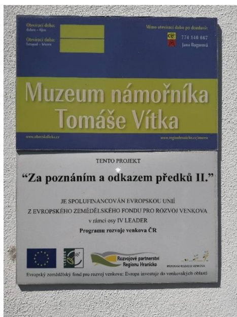
Kuva 15. Merimiesmuseo on saanut Leader-rahoitusta