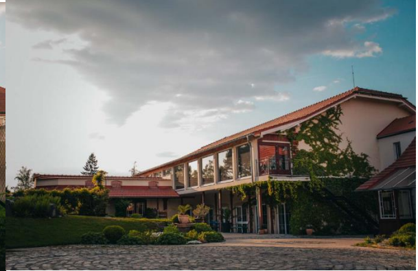
Kuva 14. Strelnice -kokonaisuuden rakennuksia