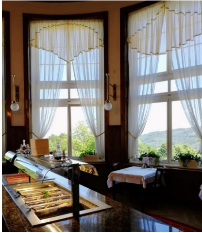
Kuva 11. Priessnitz Healing SPA