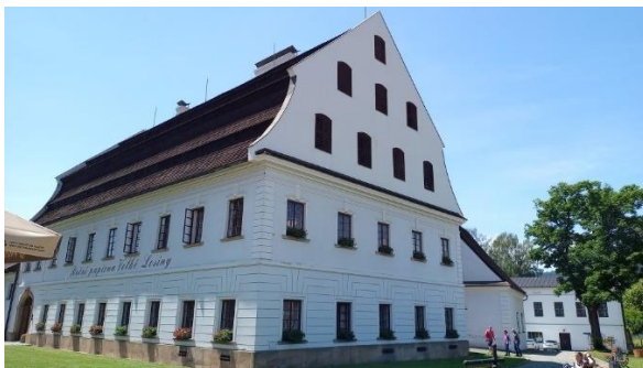
Kuva 3. Velké Losinyn paperitehdas