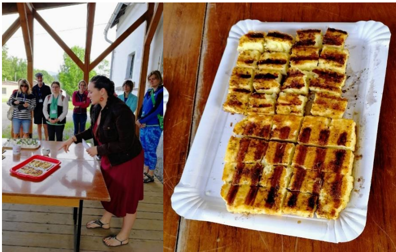
Kuva 5. juustolan yrittäjä esitteli tilan toimintaa ja tuotteita

- Kohde 1. Cheese Production in Domasov. Juustonvalmistaja -maaseutuyrittäjä. Jalostaa vain omien lampaiden, vuohien ja lehmien maitoa (600 l/pv) juustoksi (alkuperämerkitty) työllistään juustolassa 2 hlö. Pääosin valmistaa lehmän maidosta, mutta sesonkiluonteisesti myös vuohen ja lampaan maidosta erityyppisiä juustoja. Juuston markkinat ovat ravintolat ympäri Tšekkiä. Suurin haaste yrityksessä on työntekijöiden saaminen ja erityisesti nuorten houkuttelevuus maaseudulle elintarvikealan pienyritykseen töihin. Alaa ei koeta mielenkiintoisena. Alla kuvassa 5 yrittäjä esitteli tilan toimintaa ja kertoi juustonvalmistuksesta. Juustola Leader-rahoitettu kohde. Tuotanto- ja jalostustiloihin ei päästy sisälle (tautiriskien leviämisen ehkäisemiseksi), kaikki eläimet olivat laitumella.