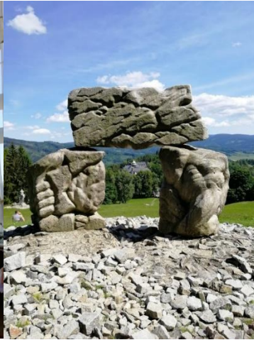
Kuva 12. hotellikylpylän läheistä puistoaluetta