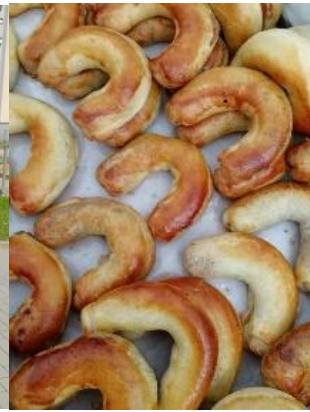
Kuva 8. perinneleipomuksia