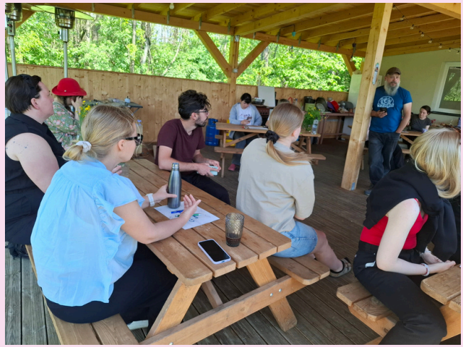
Kuva. Työpaja terassilla käynnissä.