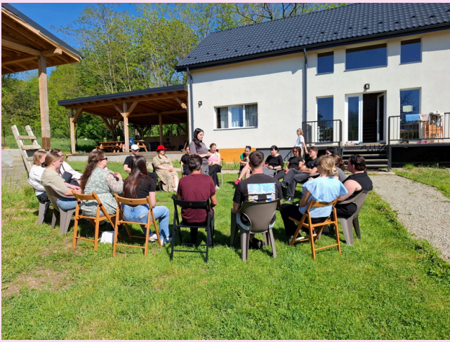
Kuva. Työpaja ulkona käynnissä.