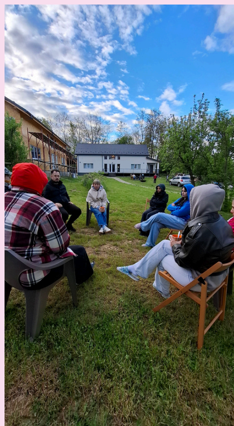
Kuva. Yrittäjä vierailulla kertomassa yrittäjystarinan.