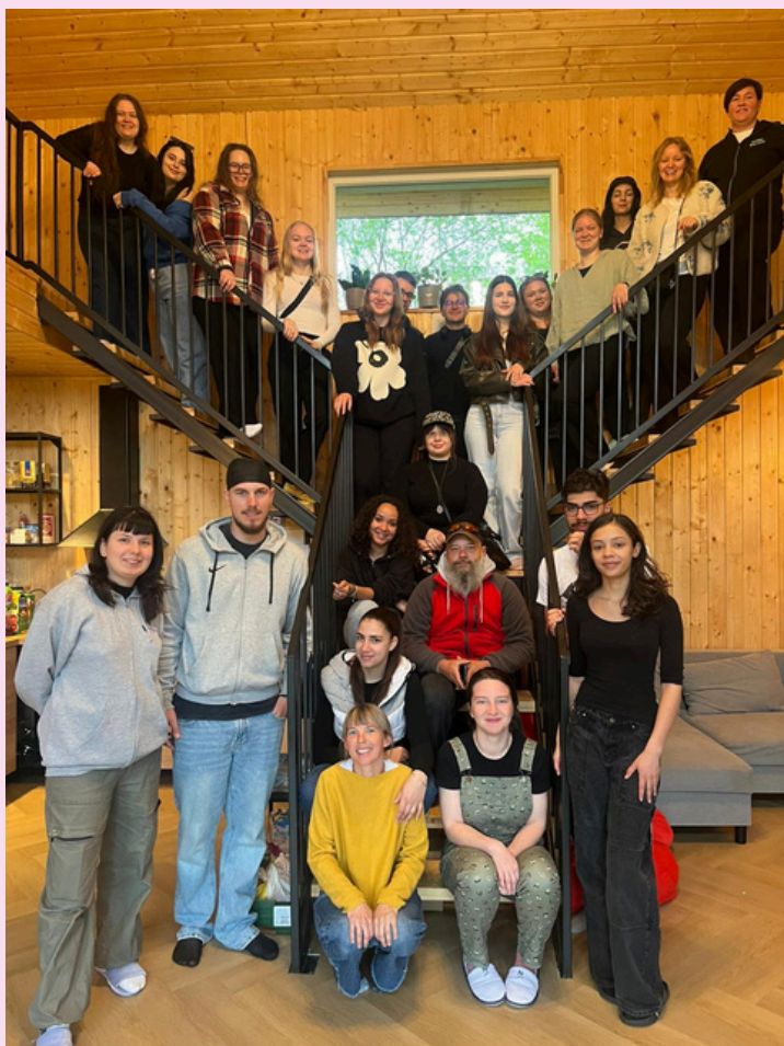
Kuva. Koko ryhmä kuvassa Romaniassa

Aikataulu oli jo suunnitelmavaiheessa päätetty projektin liikkuvuuksille, joten lennot ja käytännön järjestelyt Romanian vaihdon osalta pystyttiin hoitamaan heti alkuvuodesta myös. Romanian kumppani vastasi heidän maassaan vaihdon järjestämisestä suunnitelman mukaisesti. Joten valmistelut olivat Romanian vaihtoon lähtiessä Suomen ryhmällä vähäisempiä. Valmisteluihin kuului kuitenkin yhteinen Teams, jossa käytiin matkustamisen suunnitelmat läpi, mietittiin vietävät tuliaiset sekä refleктоitiin vielä edellistä viikkoa lyhyesti.