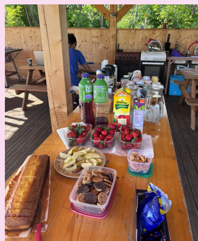
Kuva. Välipalaa katettuna terassille.

The accommodation, food and activities meet my expectations perfectly. Very good organized Exchange. Definitely 10+++ experience and I learned a lot! <3